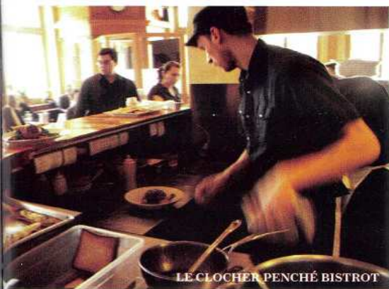
LE CLOCHER PENCHÉ BISTROT

ofrece cómodos sofás y el mejor latte de la ciudad.